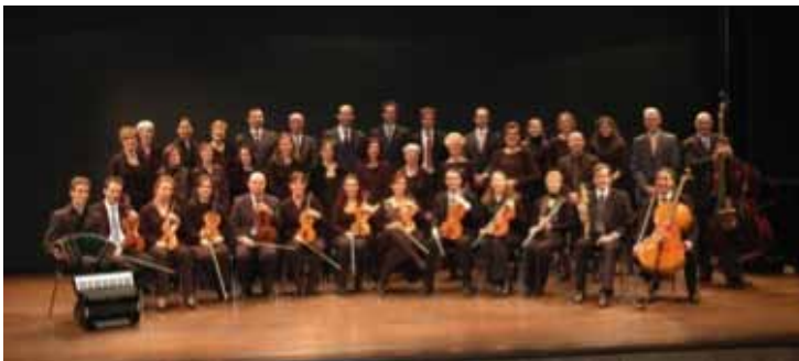
Associazione QuattrocentoQuaranta, dir. Manuel Rigamonti

P ORTAIT Il Coro Polifonico QuattrocentoQuaranta è nato nel febbraio 2001 e ha iniziato la sua attività nell'ambito dei concerti tenuti dall'Orchestra.