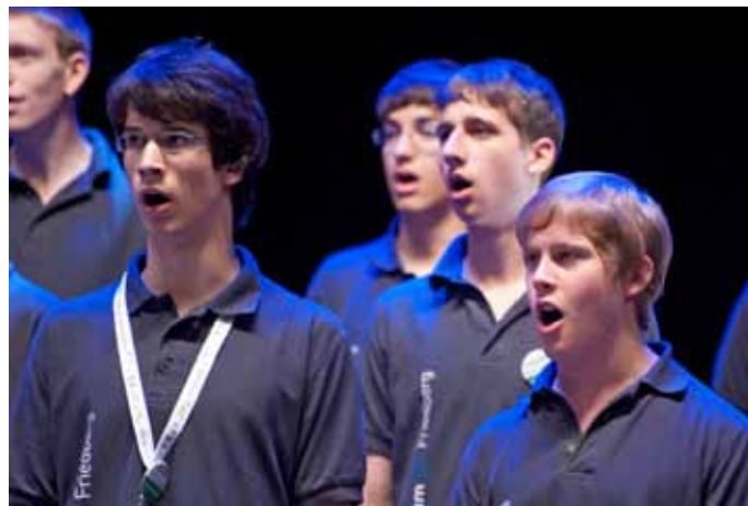
Chöre Gymi Friedberg und Mittelschule Davos

Weitere Informationen und zahlreiche Bilder von Schweizer Kinder- und Jugendchorfestivals vermittelt die SKJF-Homepage www.skjf.ch .