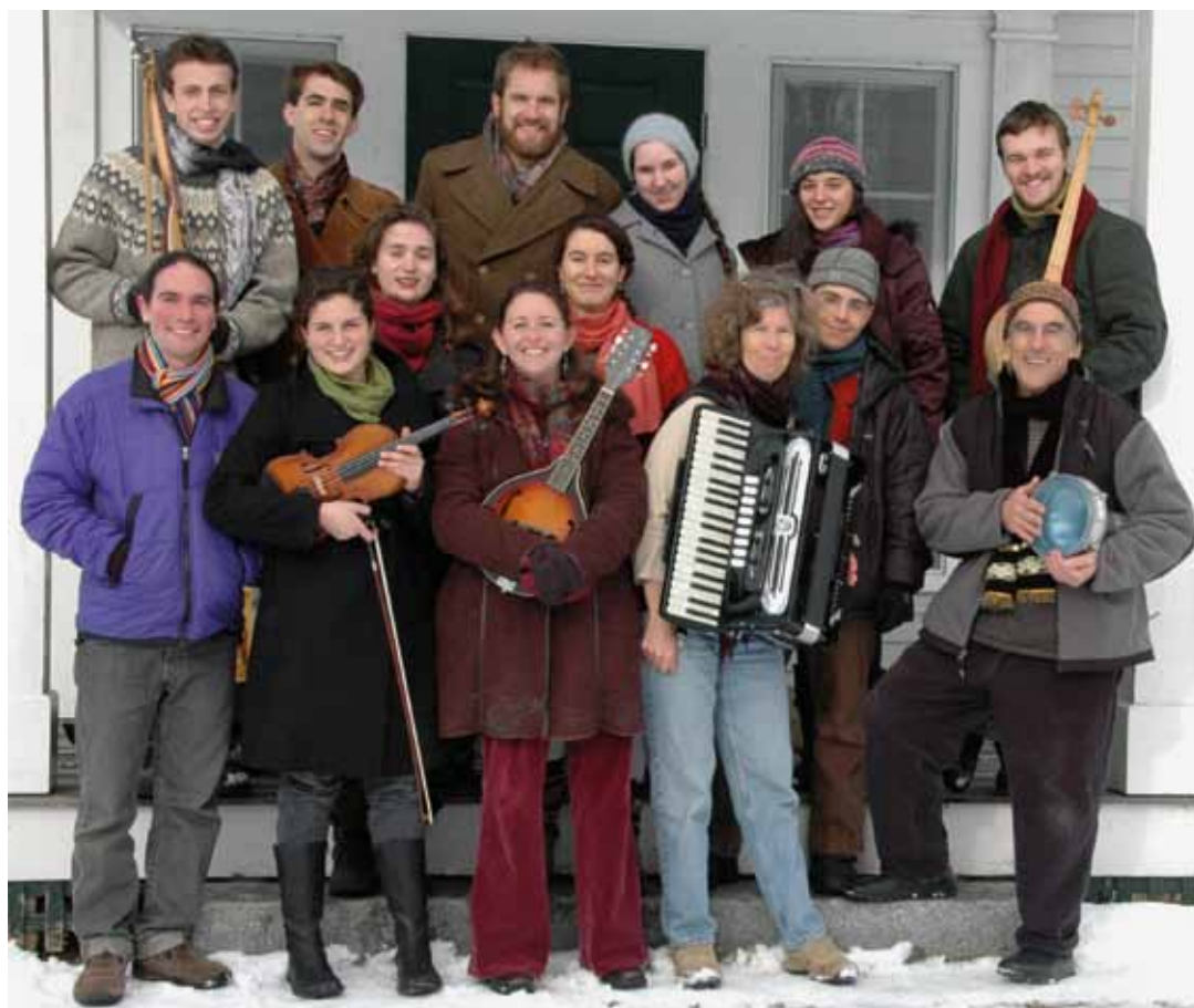
Northern Harmony 2010

Northern Harmony im Herbst 2011 auf Tournée in der Schweiz