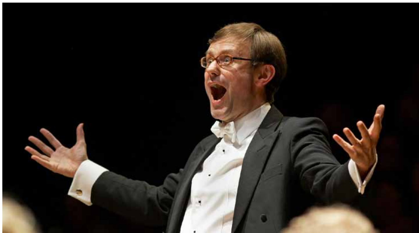
Simon Halsey

Masterclass Dirigieren Chorworkshop Konzert