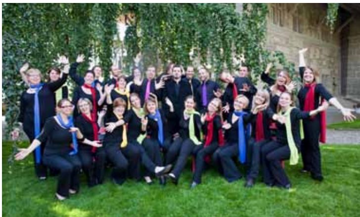
Ensemble Vocal Utopie, dir. Gonzague Monney