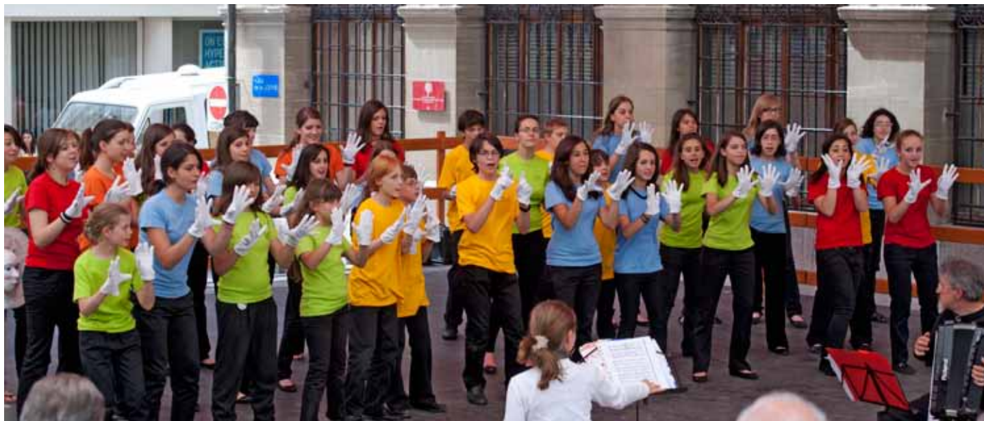
Coro di voci bianche Clairière