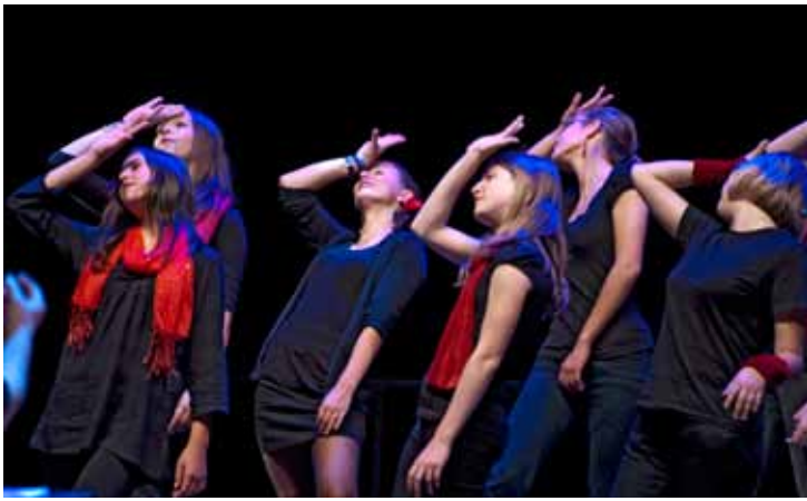
Jugendchor MKS Schaffhausen